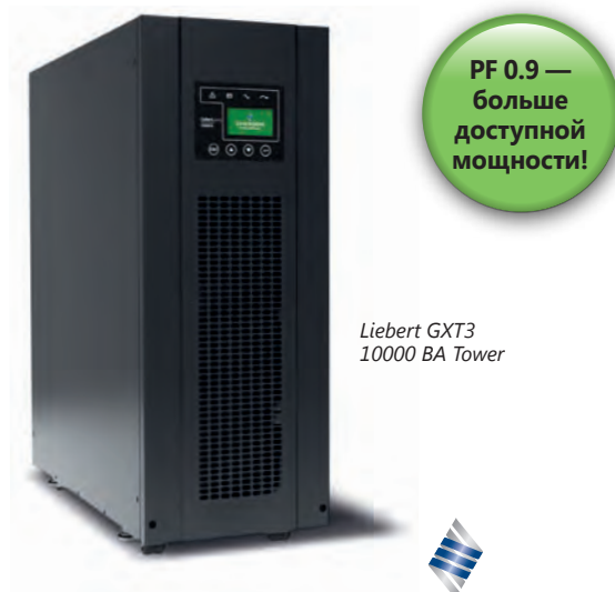
Liebert GXT3 10000 VA Tower