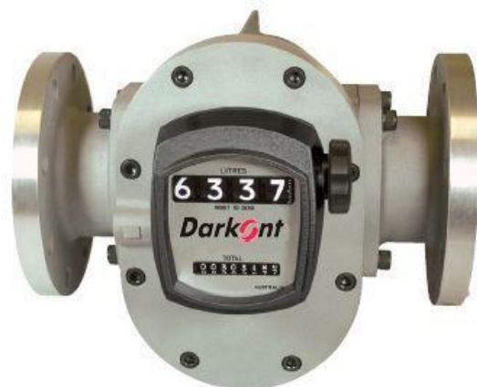
с 3-х или 4-х разрядным механическим регистратором