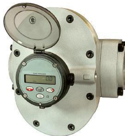
с LCD регистратором